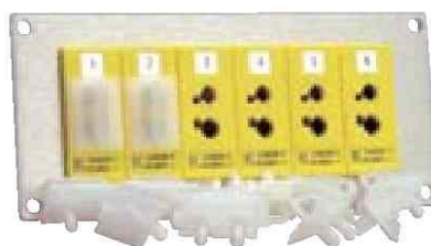
ダストキャップ SPJ-CAP-12 12 個の組

熱電対標準サイズパネルジャック付きです。 色コードはANSIで、Kタイプ熱電対用は黄色です。